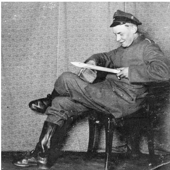
Erich Remarque 1917 als Soldat beim Brotschneiden. Sein eigener Kommentar: »Neueste Brotschneidemaschine mit Kohldampfbetrieb (unverwüstlich)«.

soll er sogar vom Schlachtfeld getragen haben. Bereits am 31. Juli 1917 trifft es ihn selbst. Granatsplitter durchbohren sein linkes Bein, den rechten Arm und den Hals. Damit ist sein Kriegseinsatz vorerst beendet. Am 25. August 1917 wird er vom Feldlazarett ins St.-Vinzenz-Hospital in Duisburg verlegt.