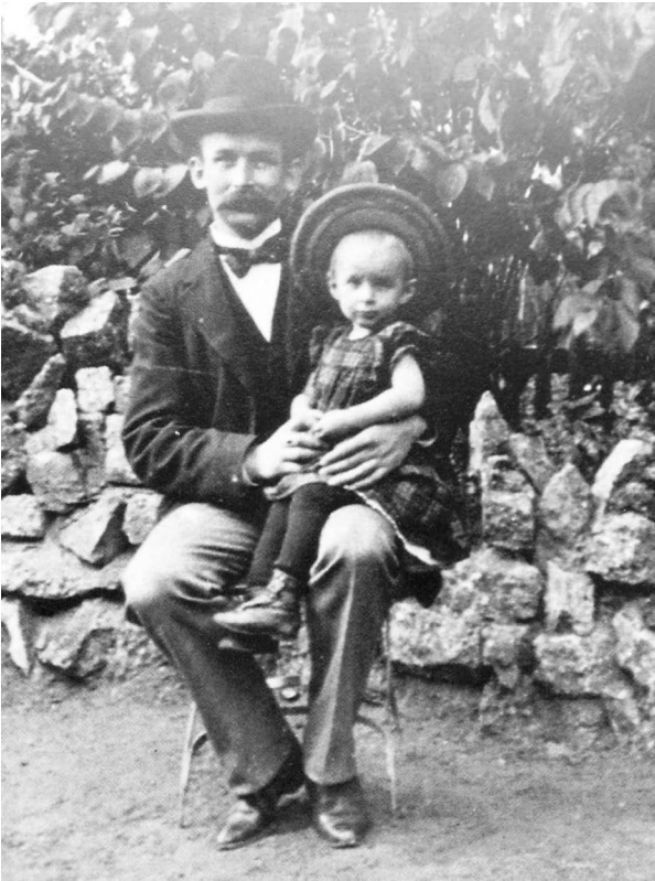
Vater und Sohn: Erich Paul Remark, geboren am 22. Juni 1898 in Osnabrück, auf dem Schoß seines Vaters, des Buchbinders Peter Franz Remark, um 1900.

zeitweise gelähmt ist. Während andere Kinder ihres Alters auf der Straße herumtollen, muss sie im Bett liegen oder im Rollstuhl sitzen. Jede Bewegung wird für sie zur Qual. Die Rückenschmerzen sind oft unerträglich. Glücklicherweise verordnet ihr ein Arzt schließlich die richtigen Medikamente, sodass die Knochen irgendwann erstarken und ihr das Laufen ermöglichen.