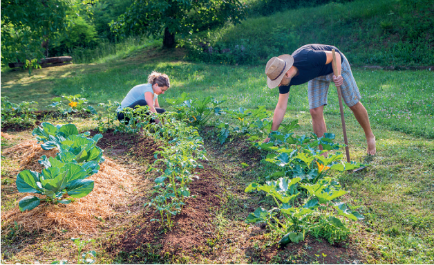
Ein Permakulturgarten: Wo vieles, das schon vorhanden ist, verwendet und miteinbezogen wird, gedeiht gesundes Gemüse.

Menschen produzieren Müll – im Gegensatz dazu gibt es in der Natur auf wundersame Weise statt Abfall nur wertvolle Rohstoffe, die in perfekten Kreisläufen immer wieder genutzt werden. Hast du dich nicht auch schon gefragt, während du die Falllaubmassen in deinem Garten zu bündigen versuchst, was eigentlich im Wald mit dem ganzen Laub passiert, das im Herbst von den Bäumen fällt? Ist dir schon mal aufgefallen, dass es in der Natur fast nirgendwo langfristig unbewachsenen, unbedeckten Boden gibt? Im Garten hingegen leidet die Erde auf den Beeten unter sommerlicher Hitze, wird rissig, trocknet aus.