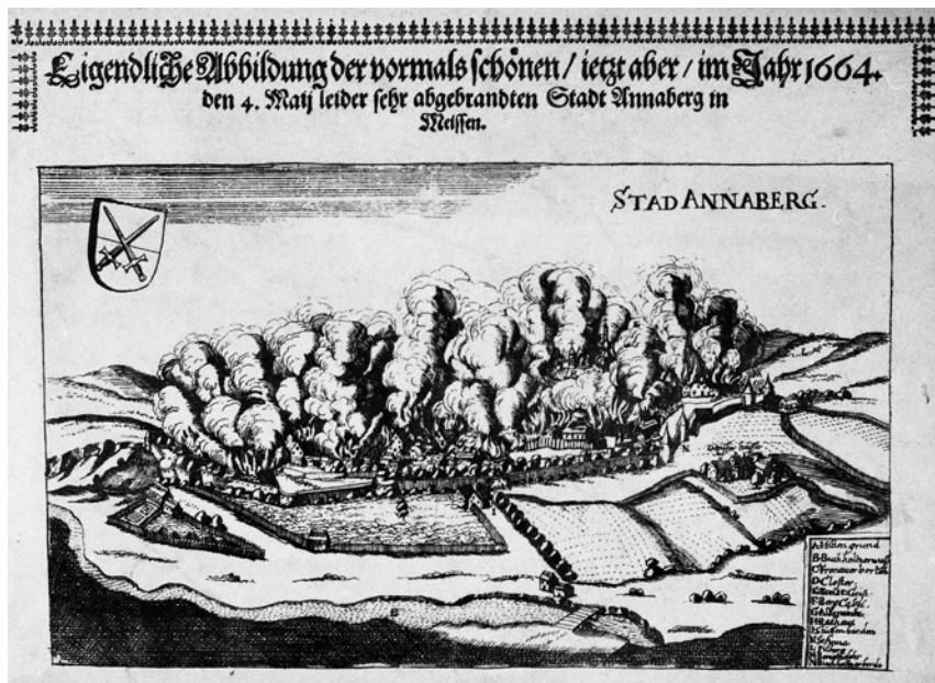
Abb. 2. Annaberger Stadtbrand 1664, Kupferstich.

St. Petersburg. Trotz der schwankenden Einwohnerzahl von geschätzten 3.000 bis 3.500 Menschen zählte Annaberg zu den größeren Städten in Sachsen. Institutionen wie das Bergamt und die Lateinschule gaben der Stadt einen überregionalen Anstrich. Die zweite Hälfte des 17. Jahrhunderts brachte keine wesentlichen Veränderungen. Bevölkerungszahl und Wirtschaftskraft blieb konstant, was sich unter anderem in den überlieferten Stadt- und Kirchenrechnungen, aber auch in der Anzahl der Geburten und Heiraten widerspiegelt. 1