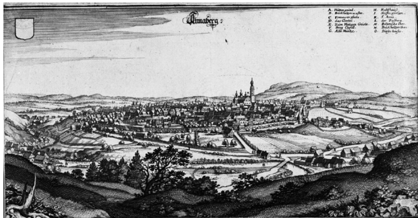
Abb. 1. Annaberg 1650, Kupferstich aus: Matthäus Merian, Topographia Superiori Saxoniae [...] , Frankfurt/Main 1650, 22/23.

Der in der ersten Hälfte des 16. Jahrhundert Annaberg bestimmende Wirtschaftszweig, der Bergbau bzw. das Montanwesen, war zwar immer noch vorhanden, hatte aber stark an Bedeutung eingebüßt. Neben den für eine Stadt typischen Gewerken waren in Annaberg von überregionaler Bedeutung das Posamentenhandwerk, die Zinngießerei, die Töpferei sowie der Handel und die beiden repräsentativen Jahrmärkte zu Lätare (vierter Fastensonntag) und St. Annen (26.07.). Die handwerklichen Erzeugnisse waren von hoher Qualität und durch die sächsischen Landesherren gefördert. Daher findet man die hochwertigsten Objekte heute in den großen Kunstgewerbemuseen von London bis