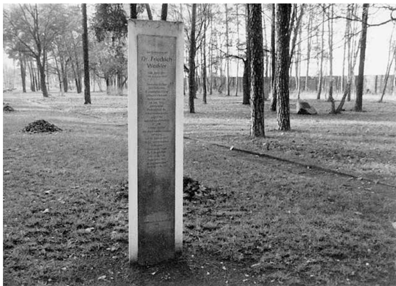
Stele für Friedrich Weißler auf dem Gelände der Gedenkstätte Sachsenhausen