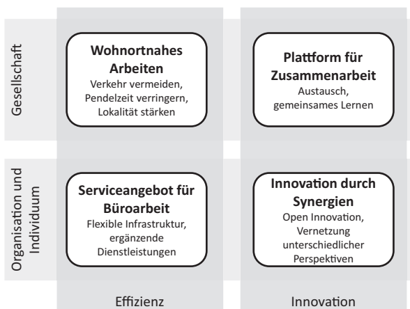
Bild 1.2: Ausprägungen von Coworking (in Anlehnung an: Josef, Back 2019, S. 785)

und unabhängige Erwerbstätige Seite an Seite oder kollaborativ zusammenarbeiten. Die Räumlichkeiten werden durch Individuen, Teams oder organisationsübergreifende Gruppen während einer bestimmten Projektphase oder auf unbestimmte Dauer genutzt, als ausschließliches oder ergänzendes Arbeit[s]szenario“ (Josef, Back 2019, S. 782). Für Coworking Spaces werden enorme Wachstumsraten vorausgesagt (vgl. Butler 2018). Coworking Spaces können in ganz unterschiedlichen Nutzungsszenarien eine Rolle spielen. Wurden Coworking Spaces ursprünglich primär von Freelancern und Startups genutzt, sind mittlerweile Unternehmen aller Größenordnungen als Nutzer zu verzeichnen. Neben den Aspekten der Effizienz, ähnlich dem Homeoffice, können Coworking Spaces einen Beitrag zur Innovation leisten (siehe Bild 1.2). Daher sollten Unternehmen in Betracht ziehen, Coworking Spaces als Option in Betracht zu ziehen. Allerdings zeigen bisherige Erkenntnisse, dass die Akzeptanz und der Nutzen sehr stark von der individuellen Situation und persönlichen Präferenzen abhängt (vgl. Josef, Back 2019, S. 786 ff.). Hier bedarf es also ebenso einer langfristigen Veränderung und Kulturanpassung.