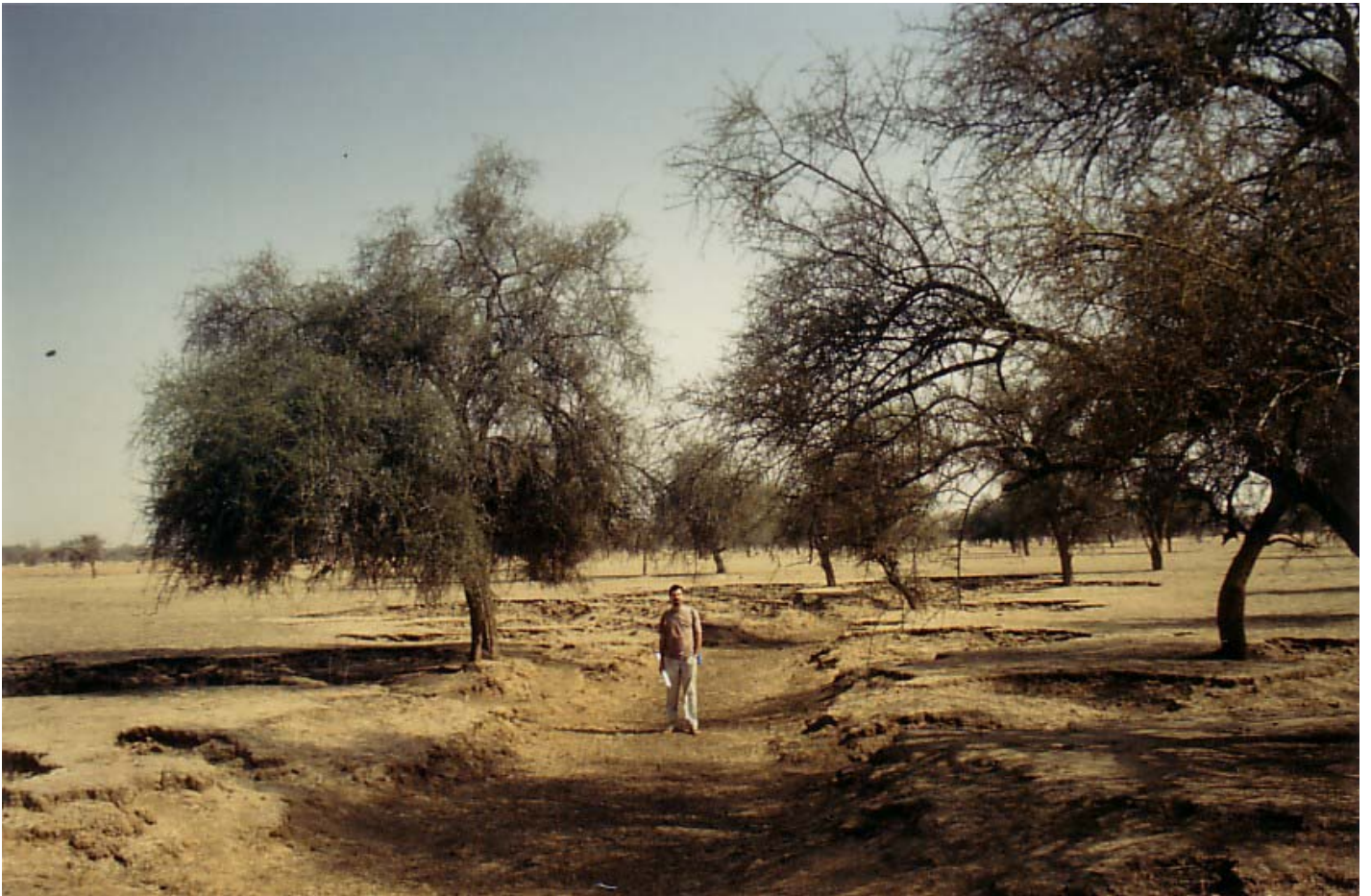
Abb. 10: Aspekt der Landschaftseinheit TD2

TD3: Mare und abflusslose Senken. In diesen Zonen kann Niederschlagswasser bis zu mehreren Wochen oder ganzjährig oberflächlich anstehen. Ganzjährig wasserführende Mare existieren im Untersuchungsraum im Bereich des Ortes Gorom-Gorom oder im Staubereich der Dünenzüge. In den abflusslosen Senken herrschen schluffig-tonige Böden mit Vertisolcharakter vor. Aspekt der Landschaftseinheit TD3 siehe Abb.11.