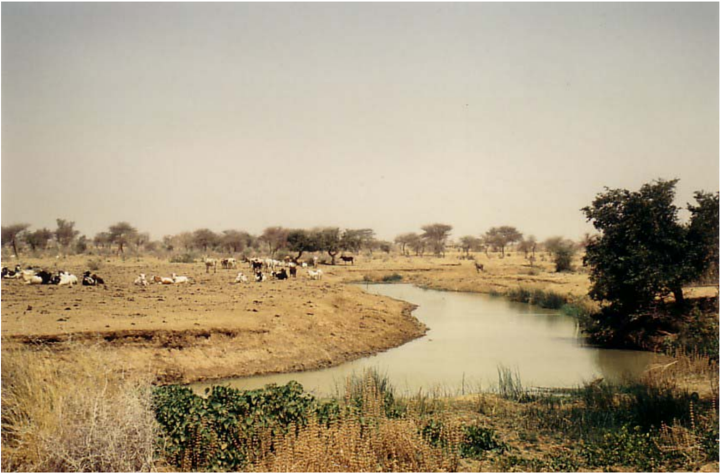
Abb. 8: Aspekt der Landschaftseinheit AS