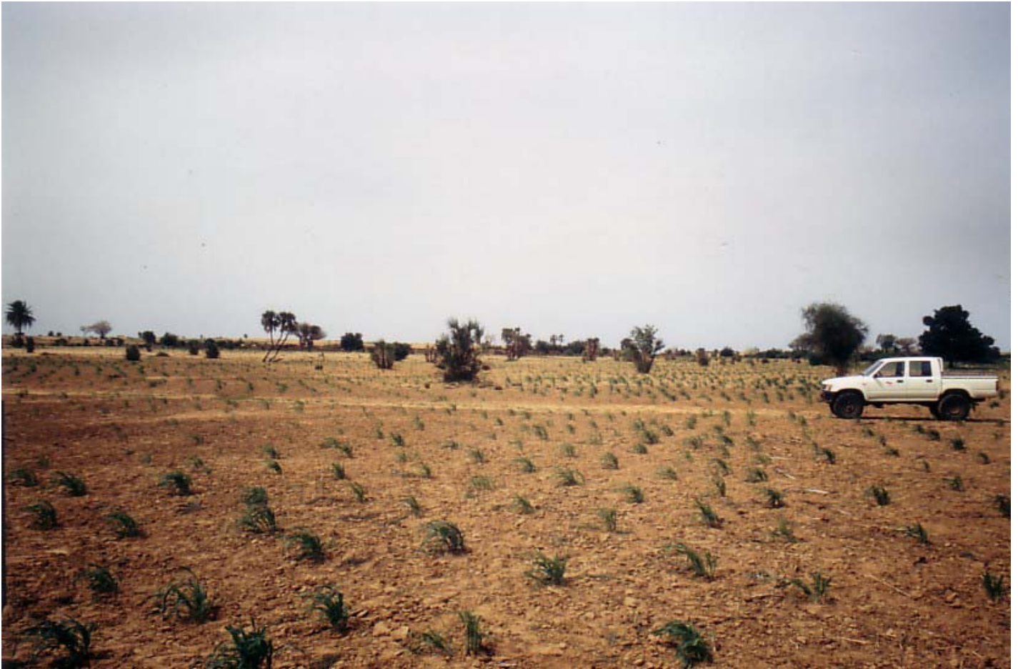
Abb. 5: Aspekt der Landschaftseinheit D 2

Diese Standorte sind für die Beweidung bevorzugt. Aspekt der Landschaftseinheit TS siehe Abb. 7.