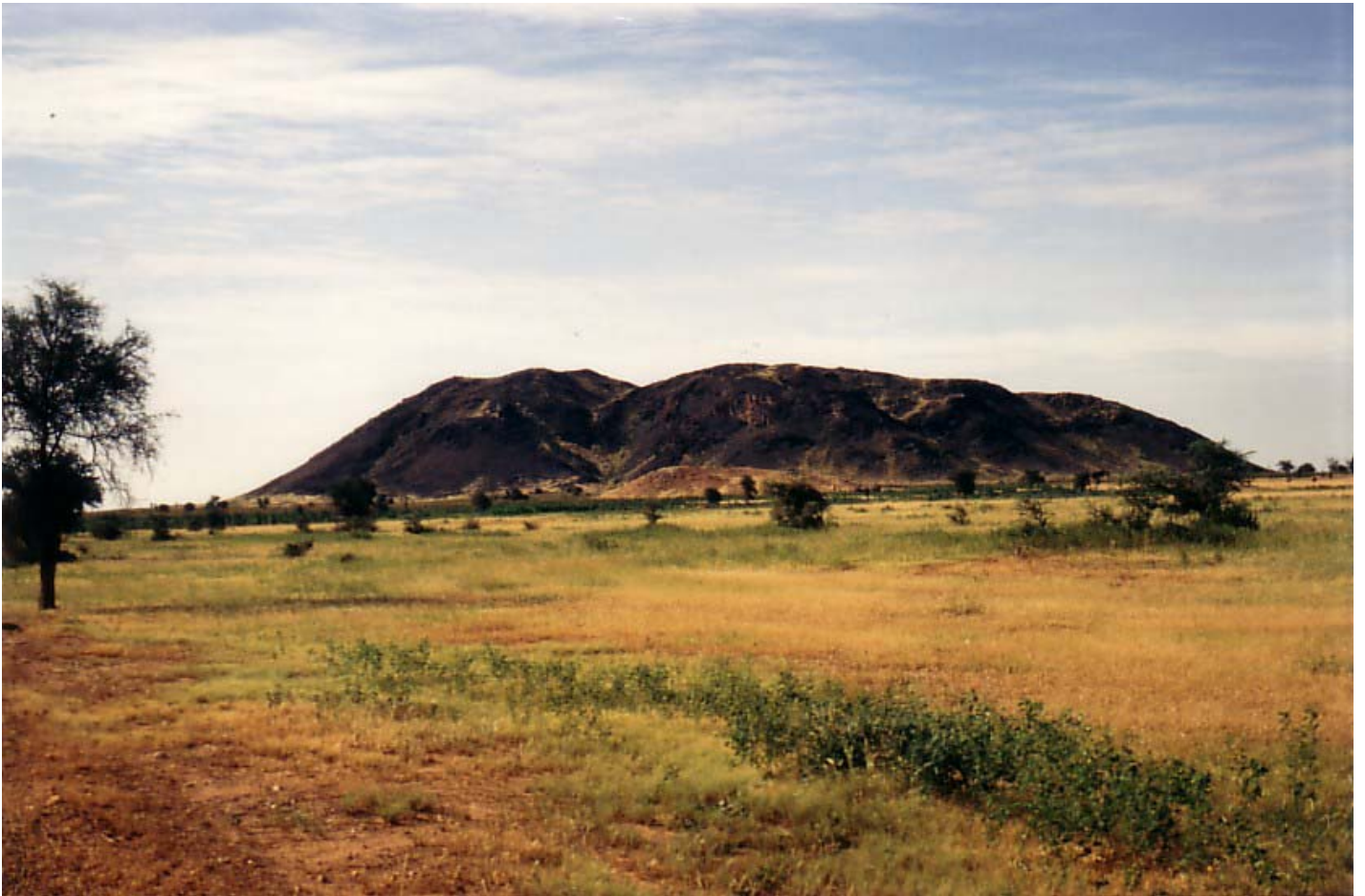
Abb. 12: Aspekt der Landschaftseinheit RI

RGs: Granit-Schildinselberge, die nur geringe Höhen im Untersuchungsgebiet erreichen und eine starke Wollsackverwitterung aufweisen. Die Granit-/Migmatit-Schildinselberge werden meist von einem Glacis aus Granitgrus und Dünensand umgeben. Größere Granit-Inselberge finden sich außerhalb des Untersuchungsgebiets in der Region von Aribinda. Aspekt der Landschaftseinheit RGs siehe Abb. 13.