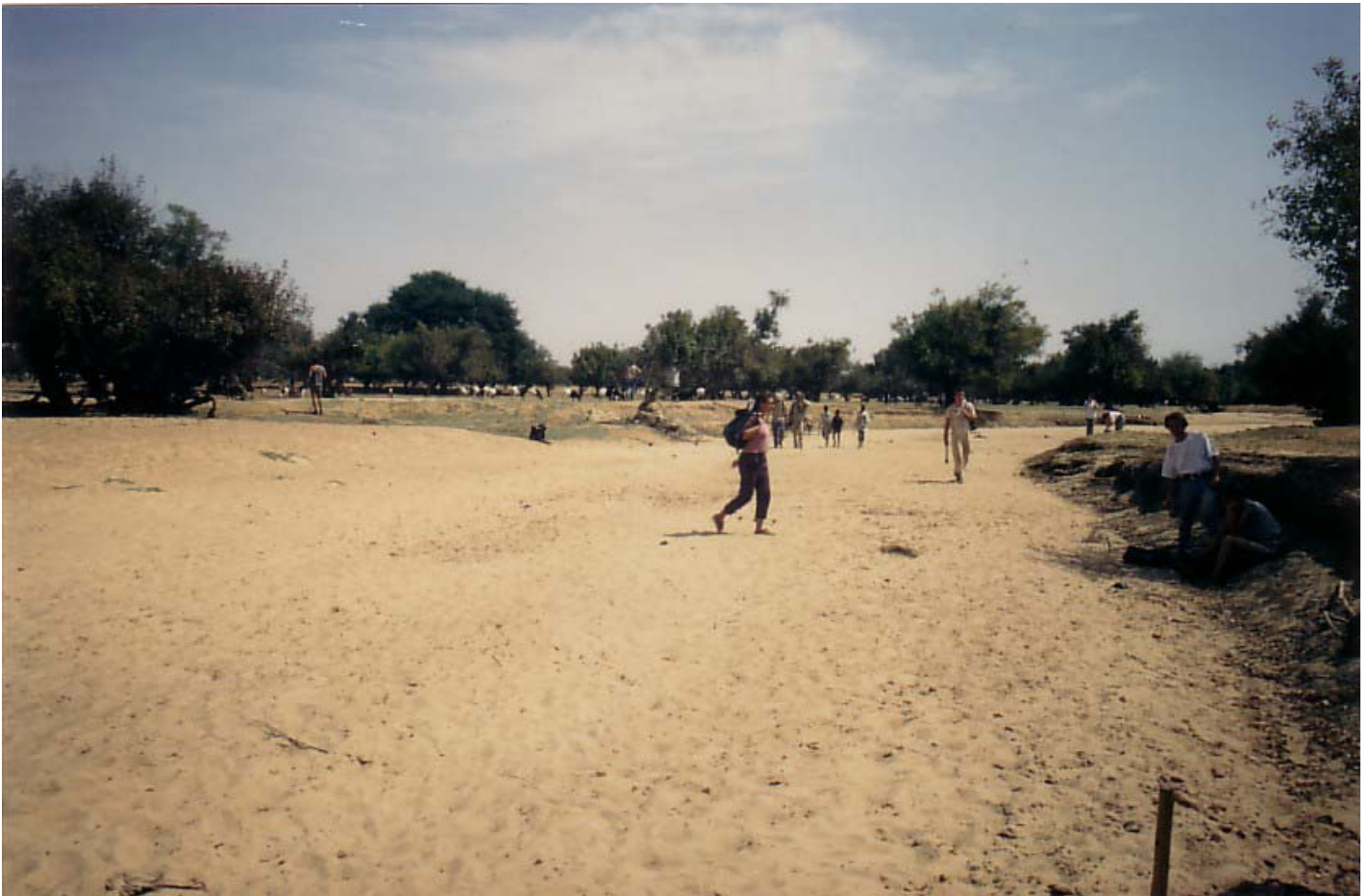
Abb. 9: Aspekt der Landschaftseinheit TD1

TD2: Nebenabflüsse mit erweiterten Senken (bas fonds), die ein geringes Gefälle haben und durch ihre flächige Ausdehnung eine schlechte Entwässerung bewirken. In dieser Untereinheit sind dunkle Vertisolböden verbreitet, deren Substrat die Herausbildung einer dichten „savane arbustive“ begünstigt. Auf den verdichteten Lehmböden ist der Anteil an Gehölzen sehr gering. Gramineen sind verbreitet, insbesondere Aristida funiculata und Schoenefeldia gracilis , weiterhin finden sich an Gramineen Echinochloa colonum , Eragrostis pilosa , Panicum laetum , Sporobolus helvolus und Sorghum spp. Der Wert für die Beweidung wird hoch eingeschätzt. Aspekt der Landschaftseinheit TD2 siehe Abb. 10.